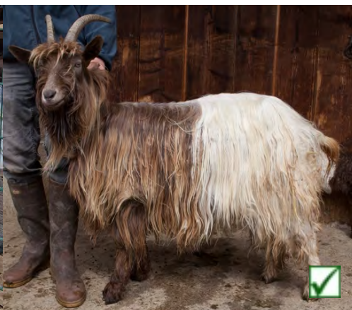
20 cm Bodenfreiheit | 20 cm de garde au sol | 20 cm di distanza da terra