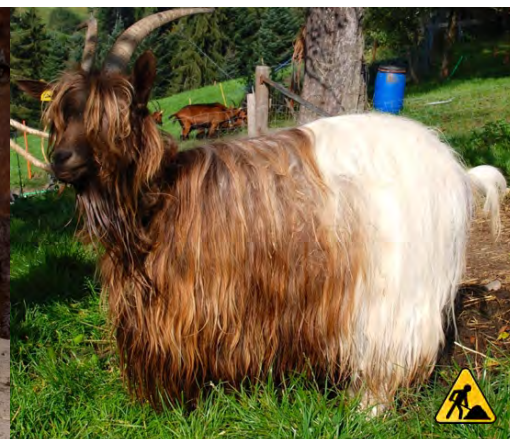
zu lang | trop long | troppo lungo