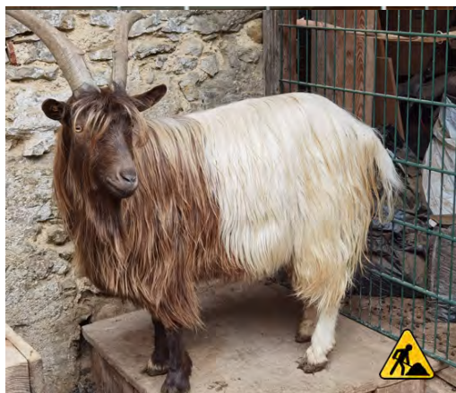
zu kurz | trop court | troppo corto