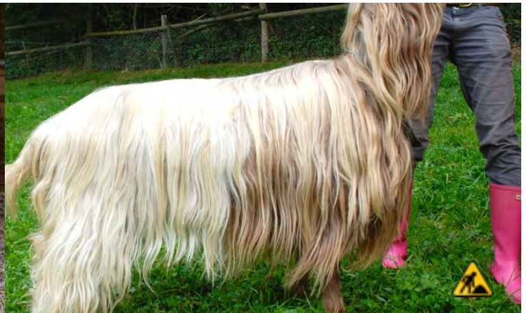
zu hell | trop clair | troppo chiaro