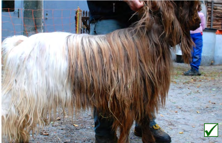
dunkel | foncé | scuro