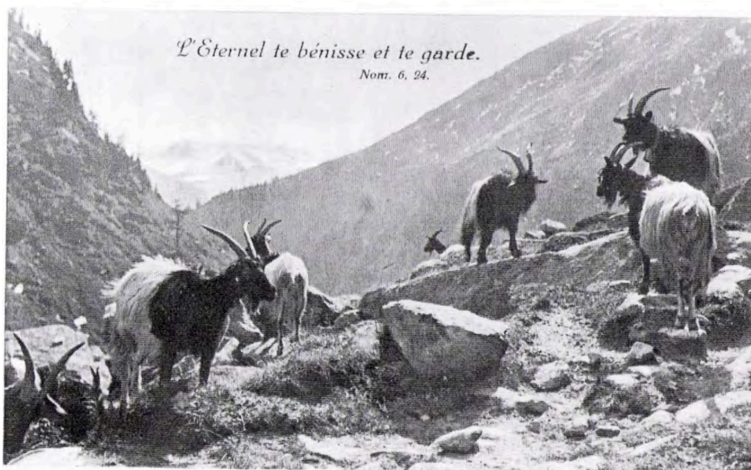
Historische Fotoaufnahme (undatiert)