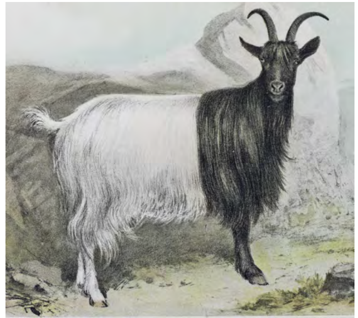
„Die Ziegenrassen der Schweiz“ von N. Julmy 1896