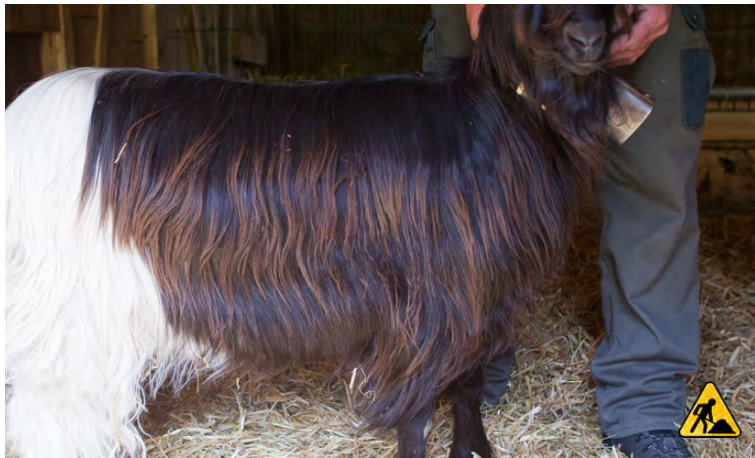
zu dunkel | trop foncé | troppo scuro