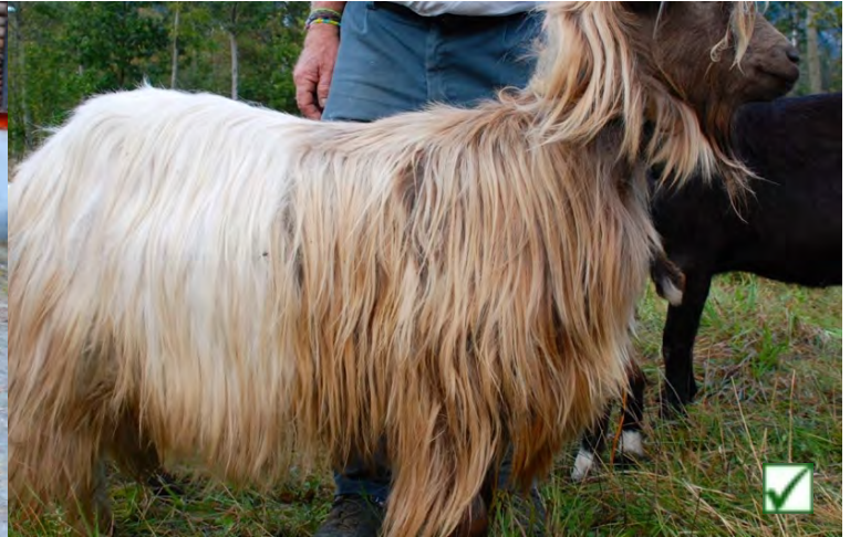
hell | clair | chiaro