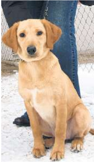
Wer kennt «Mara» oder ihre Besitzer?

MELLINGEN Welpen an der Reuss ausgesetzt. Vor Wochenfrist wurde in Mellingen ein dreimonatiger Welpen gefunden. Bis jetzt hat sich jedoch niemand weder bei der Polizei noch bei einem Tierheim gemeldet. Der kleine Labrador-Mischling wurde offenbar ausgesetzt. Marlies Widmer vom Aargauischen Tierschutz würde es nicht verwundern, wenn es sich um ein so genanntes Weihnachtstier handeln würde, das nicht mehr erwünscht ist. «Mara», wie die Junghündin genannt wird, trug weder Halsband, noch ist sie bereits gechipt worden. Sie ist derzeit im Tierheim in Untersiggenthal, wo sich die Besitzer allenfalls noch melden können, und zwar unter 056 298 00 22. (-rr-)