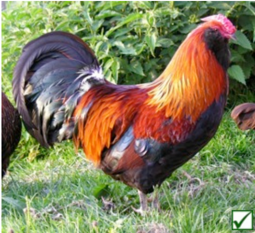
rebhuhnhsig • col perdrix